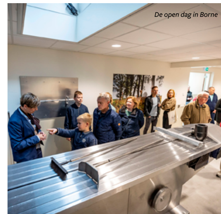
De open dag in Borne

Bij crematies komen waardevolle metalen vrij, die opgeteld een flink bedrag vertegenwoordigen. Officieel is het eigendom van de crematoria, maar de Nederlandse crematoria geven het terug aan de maatschappij. Daarvoor hebben zij vele jaren geleden het Vaillant Fonds opgericht, dat de dankbare taak heeft om goede doelen in zorg en welzijn te selecteren en steunen. Het bedrijf Orthometals is verantwoordelijk voor het recyclen van alle metalen die overblijven na crematie. De medewerkers van Crematiebegeleiding en Asbestemming gingen op werkbezoek bij Orthometals om met eigen ogen te zien wat er gebeurt met de (edel)metalen nadat zij dit hebben gescheiden van de as van de overledene.