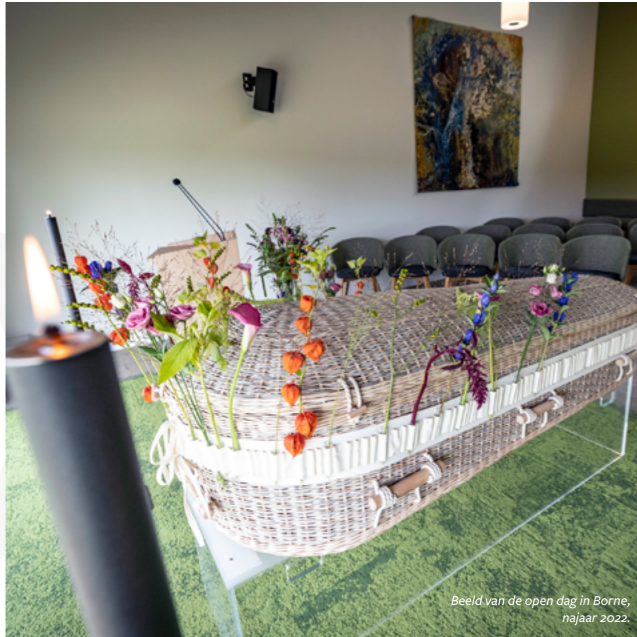
Beeld van de open dag in Borne, najaar 2022.

IS HET NOG STEEDS ZO DRUK BIJ JULLIE? Dit was veruit de meest gestelde vraag in 2022. Na twee coronajaren was de verwachting dat het sterftcijfer weer terug zouden gaan naar de normale CBS-verwachting. Maar niets was minder waar. Dat de oversterfte na de coronapandemie zou aanhouden had niemand verwacht. De oversterfte in 2022 valt nog niet te verklaren.