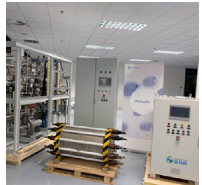
Opstelling van de elektrolyser bij de waterstofhub Twente.

De bestaande ovens kunnen relatief gemakkelijk worden omgebouwd naar waterstof. Dit in tegenstelling tot elektrisch cremieren. Eind 2022 is een opzet voor een haalbaarheidsstudie naar de energietransitie voor het hoge-temperatuur crematieproces op locatie Enschede opgezet. Bij de provincie Overijssel is hiervoor subsidie aangevraagd. Doel van deze haalbaarheidsstudie